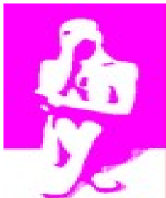
Teatro La Paca